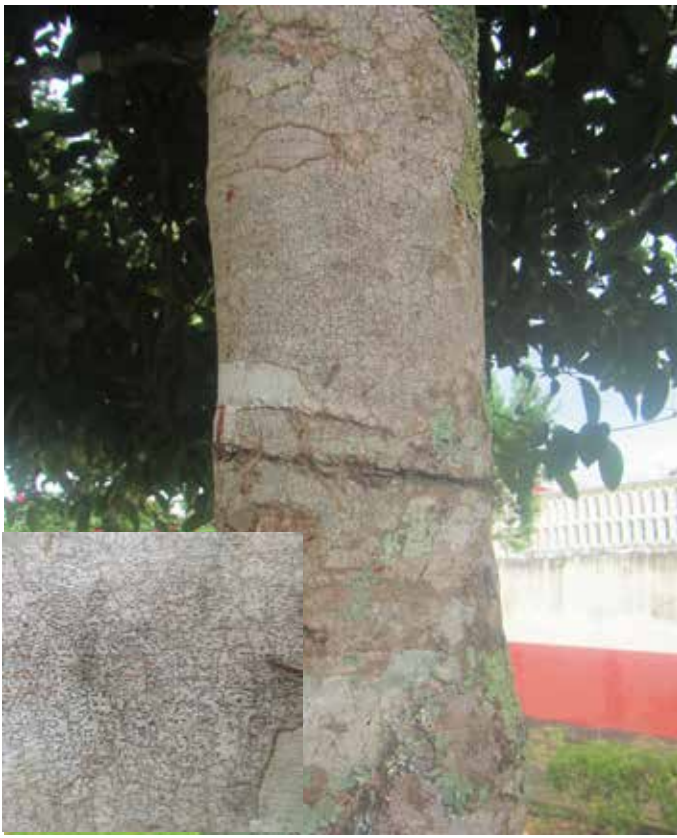
Corteza. Color marrón grisáceo.